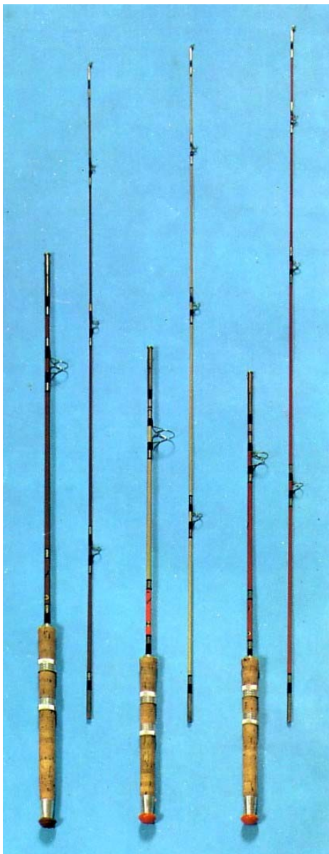
Drie Fair Play ultralichte spinhengels uit de jaren zestig, met v.l.n.r. 4, 5 en 6 gram werpvermogen.

Het ultralichte spinnen is in Nederland vanaf het einde van de jaren veertig van de vorige eeuw tot ontwikkeling is gekomen. Verreweg het meeste baanbrekende en propagerende werk is daarbij verricht door de grote man van de Nederlandse hengelsport in de twintigste eeuw, Jan Schreiner. De oorsprong van het ultralichte spinnen ligt echter in Frankrijk en de uit dat land geïmporteerde materialen en technieken zijn van belangrijke invloed geweest op de manier waarop de ultralichte kunstaasvisserij bij ons werd en wordt beoefend.