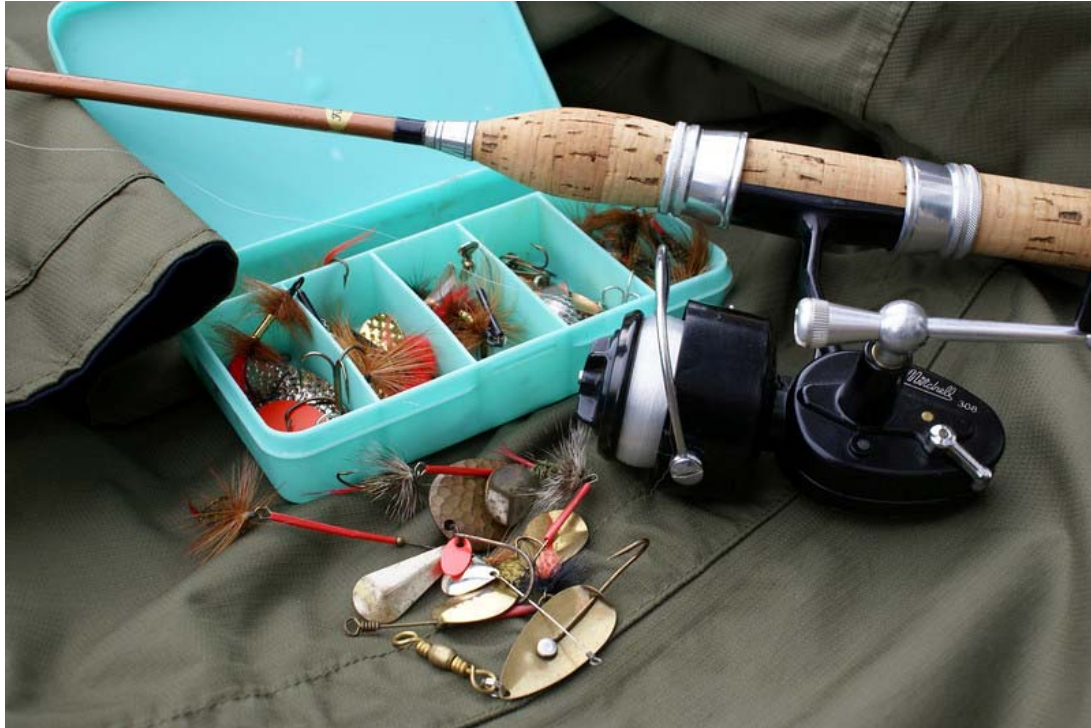
Fair Play 4-grams ultralicht spinhengeltje met een ultralicht Mitchell 308 Benjamin molentje.

Als ultralicht molentje vinden we al in de eerste druk van Flitsend Nylon (1950) de Alcedo Micron afgebeeld, een fraai Italiaans stukje techniek van maar 190 gram. Een paar jaar later kwam Pelican, een merk uit dezelfde Turijnse fabriek als Alcedo, met een ultralicht model, de Pelican 50, dat veel verkocht werd. Maar ook de al eerder genoemde kleine Luxor molen werd, hoewel wat zwaarder, indertijd veel voor het ultralichte werk gebruikt.